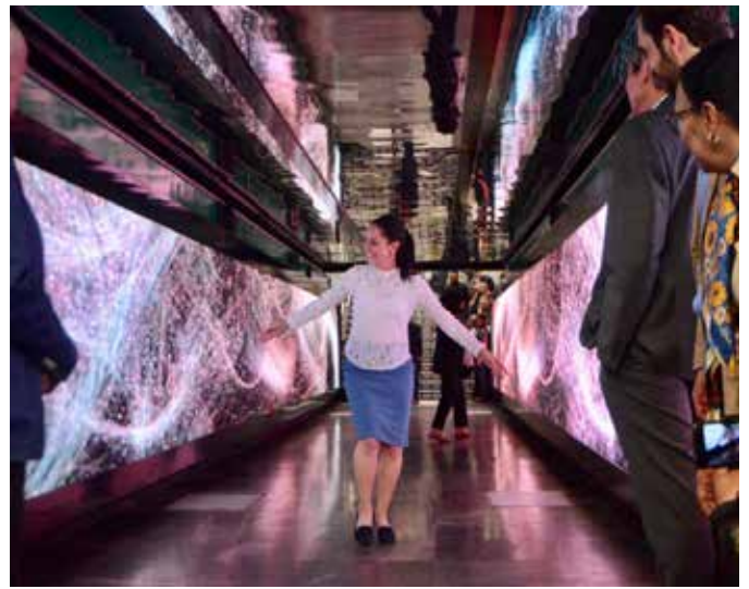
La Jefa de Gobierno de la Ciudad de México en la Galería Metro.