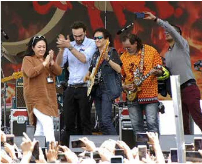
La directora del STC Metro, el secretario de Movilidad y El Tri en el festejo.